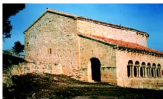
▲ Imágenes de Hinojosa