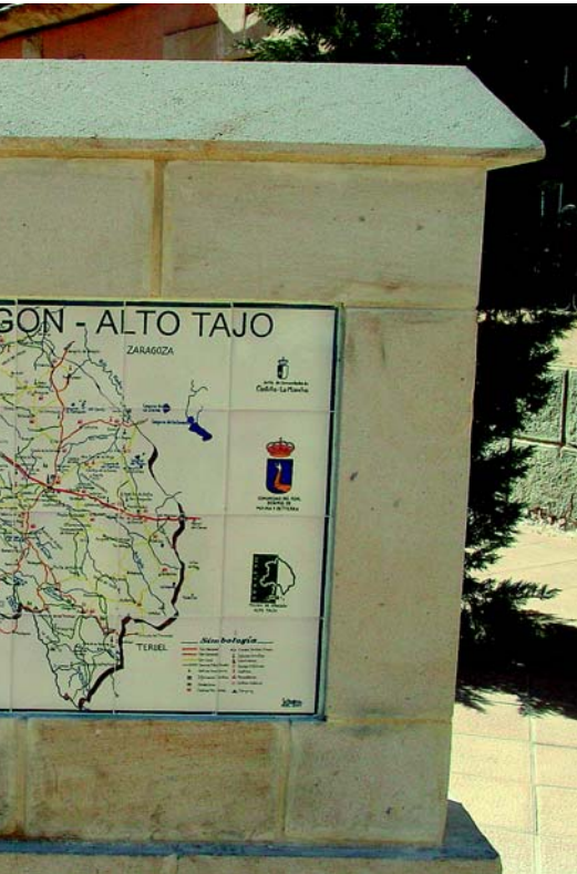
Mural de señalización Comarcal en Molina de Aragón ▲

página web www.molina-altotajo.com , ambas dirigidas por el CEDER Molina de Aragón – Alto Tajo, que además ha llevado a cabo un profundo estudio de la demanda turística de la Comarca.