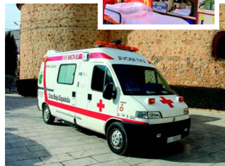
UVI móvil 4x4 ▶

Por otro lado el Local de Reconocimiento ha permitido la realización de prueba médicas y psicotécnicas, necesarias para la obtención de determinados permisos, entre ellos el carnet de conducir. Facilitando, por el tanto, el acceso de los mismos por la población comarcal.